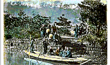
Oriente Felice Beato, «Traghetto a Kanasawa» (1868 ca)